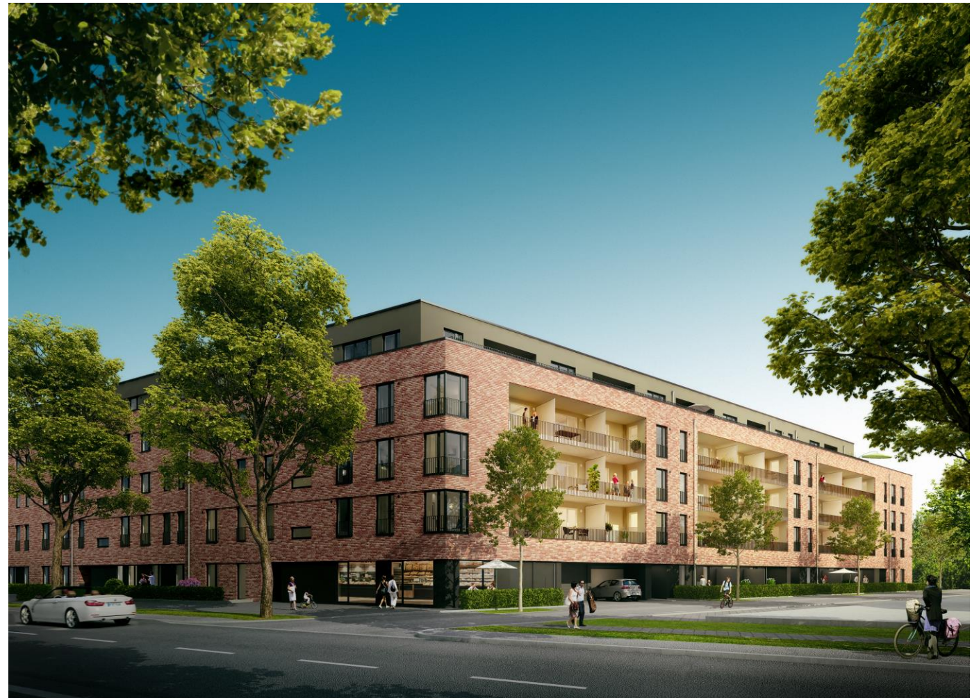
Die Visualisierung zeigt den Blick von der Hamburger Straße.

Auf vertraglicher Grundlage des Hamburger Mietvertrages für Wohnraum werden ein Kündigungsausschluss von 24 Monaten und eine Staffelmiete vereinbart.